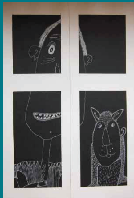
1. místo kat. 6-10 let: Michal Ožana, 8 let, Můj děda se svým psem, ZŠ Emila Zátopka, Koprivnice