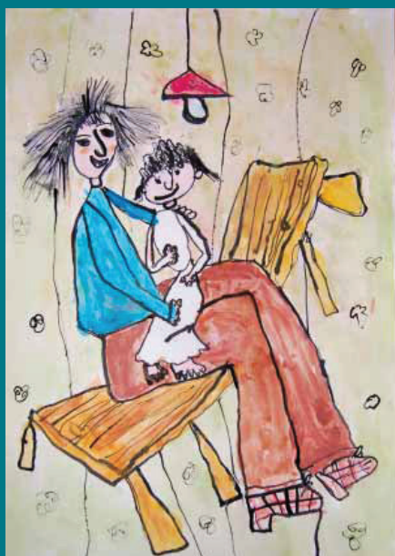
1. místo kat. do 5 let: Nikolka Čapková, 5 let, Povídám si s dědečkem, MŠ Raspenava