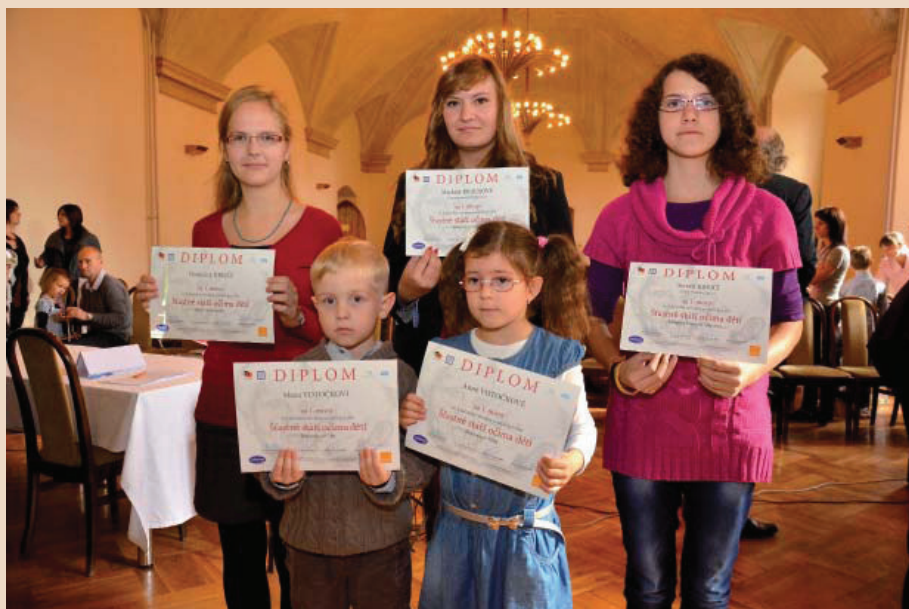
Vítězové jednotlivých kategorií

V pražských Emauzích proběhlo dne 9. 10. 2012 slavnostní vyhlášení vítězů 3. ročníku výtvarné soutěže Šťastné stáří očima dětí.